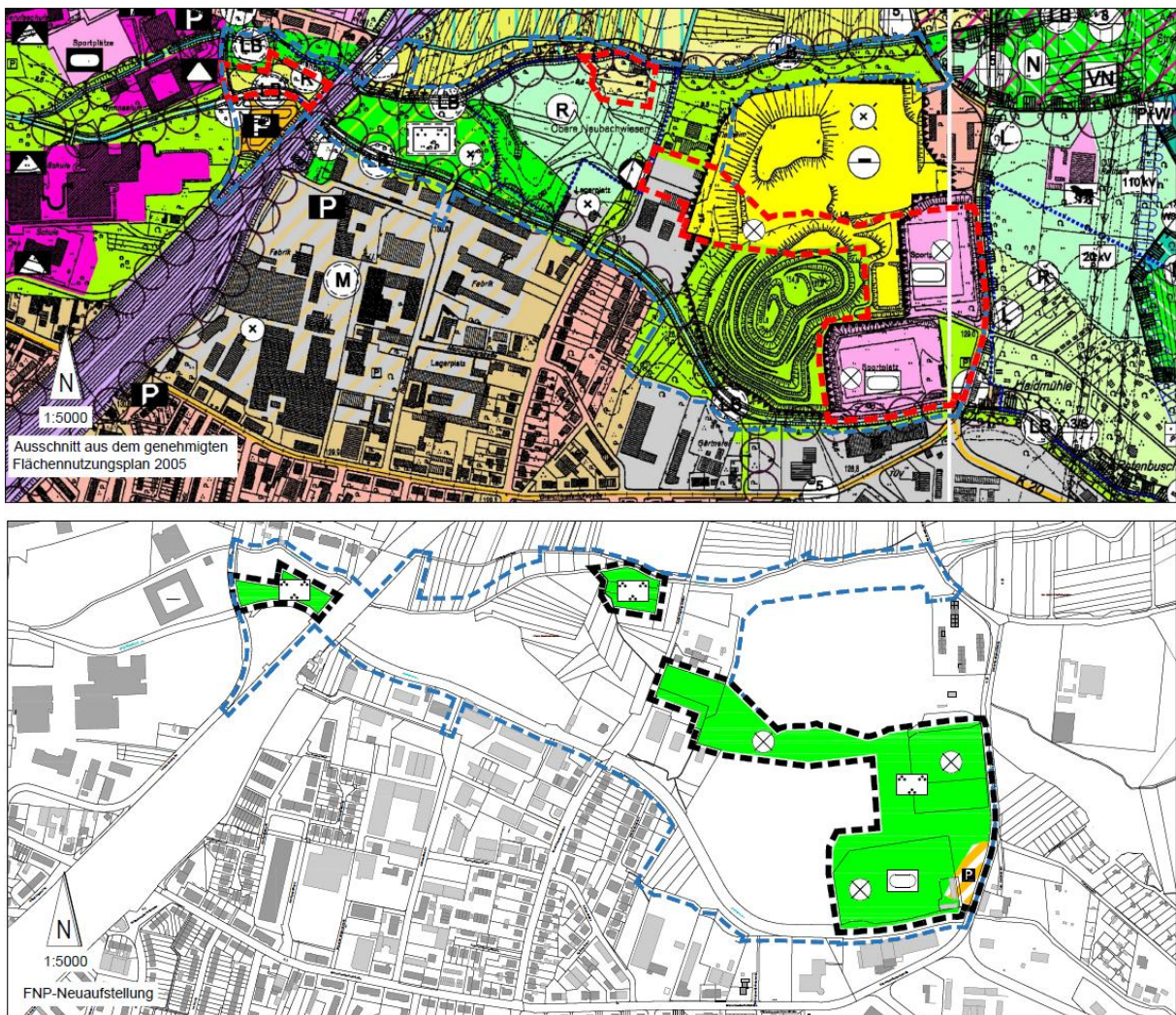
Abbildung 1: wirksame FNP Neuaufstellung „Landesgartenschau“

Im wirksamen Flächennutzungsplan 2005 ist an dieser Stelle eine Fläche für die Abfallentsorgung (ehemaliges Abfallwirtschaftszentrum) und eine Wohnbaufläche (Schlichtwohnungen) dargestellt. Für den Bebauungsplan „Landesgartenschau“ ist der Flächennutzungsplan schon einmal angepasst worden. Seit dem 13.02.2025 ist diese Änderung wirksam. Die Fläche des ehemaligen Hartplatzes, die sowohl in der Neuaufstellung des FNP 2040 und im wirksamen, an dieser Stelle bereits geänderten FNP 2005 ist als Grünfläche dargestellt.