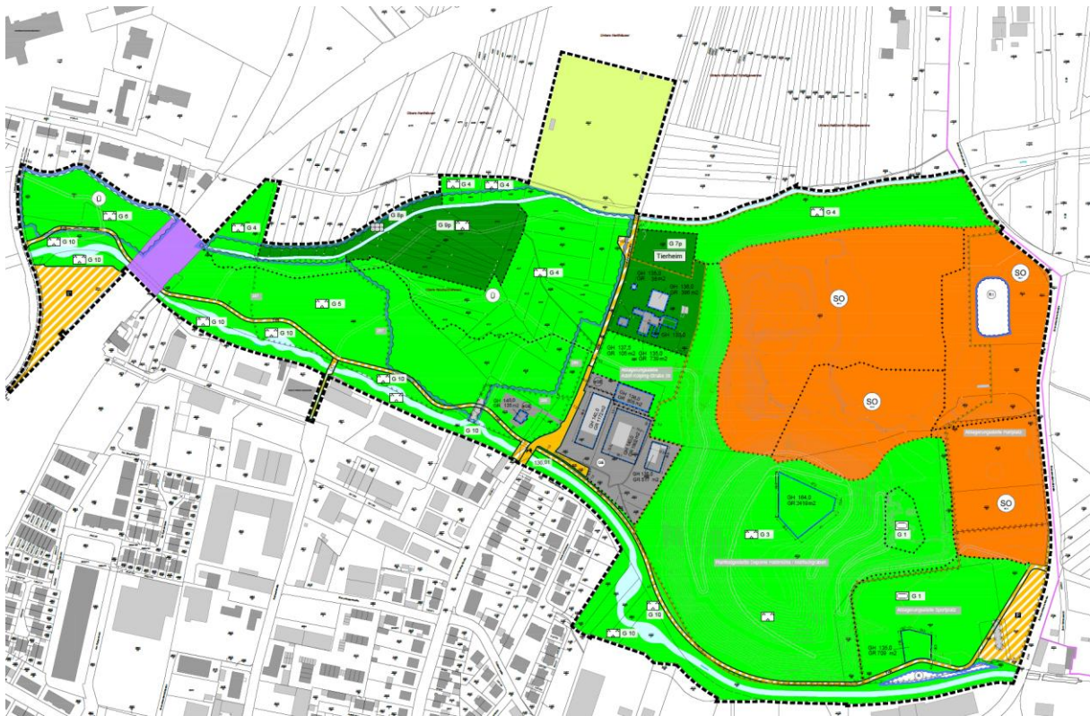
Abbildung 2: Bebauungsplan Vorentwurf „Landesgartenschau I. Änderung und Erweiterung“

Der Bebauungsplan sieht auf diesen Flächen ein Sondergebiet, dass der Erholung dient vor. Insofern ist der Bebauungsplan in Teilen nicht aus dem Flächennutzungsplan entwickelt (Entwicklungsgebot § 8 Abs. 2 Satz 1 BauGB). Demnach ist der Flächennutzungsplan in den entsprechenden Teilbereichen zu ändern.