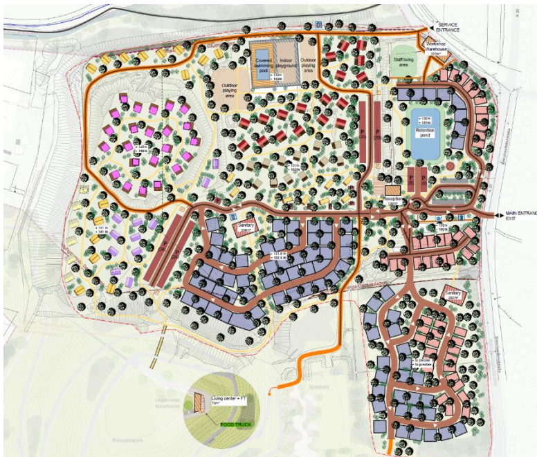
Abbildung 3: Entwurfsplanung Huttopia Campings Stand April 2025 (unmaßstäblich)

Die Änderungsverfahren des FNP wird im Parallelverfahren zeitgleich mit der Bebauungsplanänderung „Landesgartenschau I. Änderung und Erweiterung“ durchgeführt.