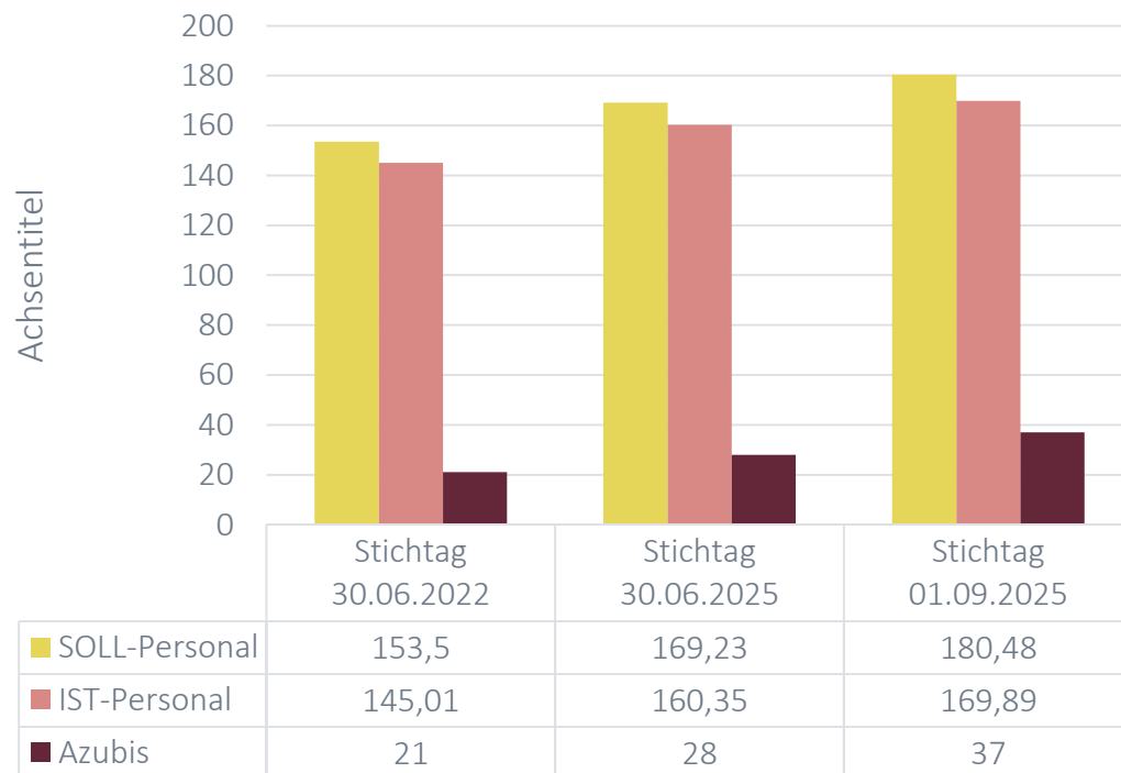
Stand Päd. Personal